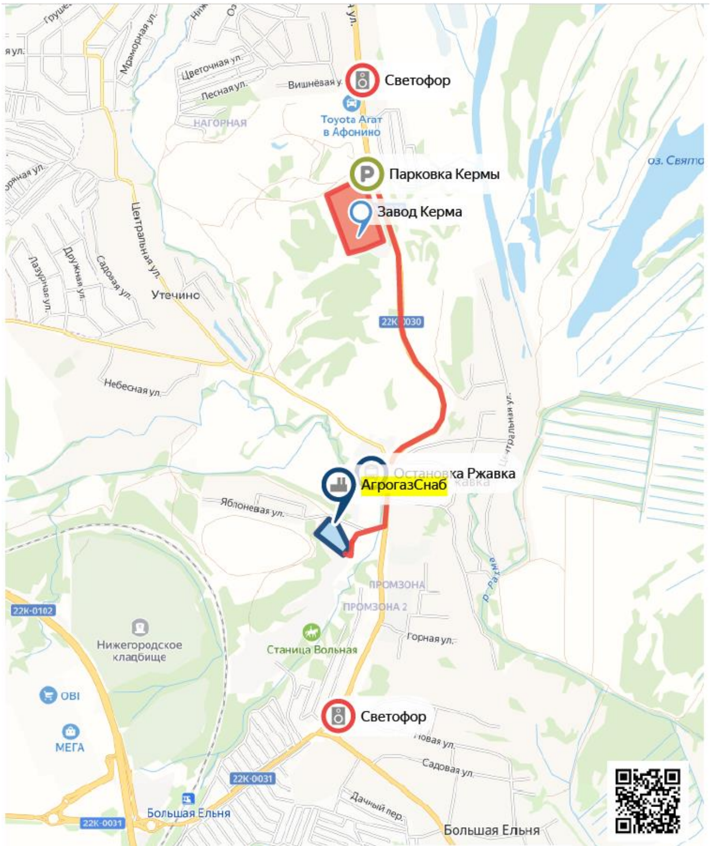
Схема проезда на площадку АгрогазСнаб